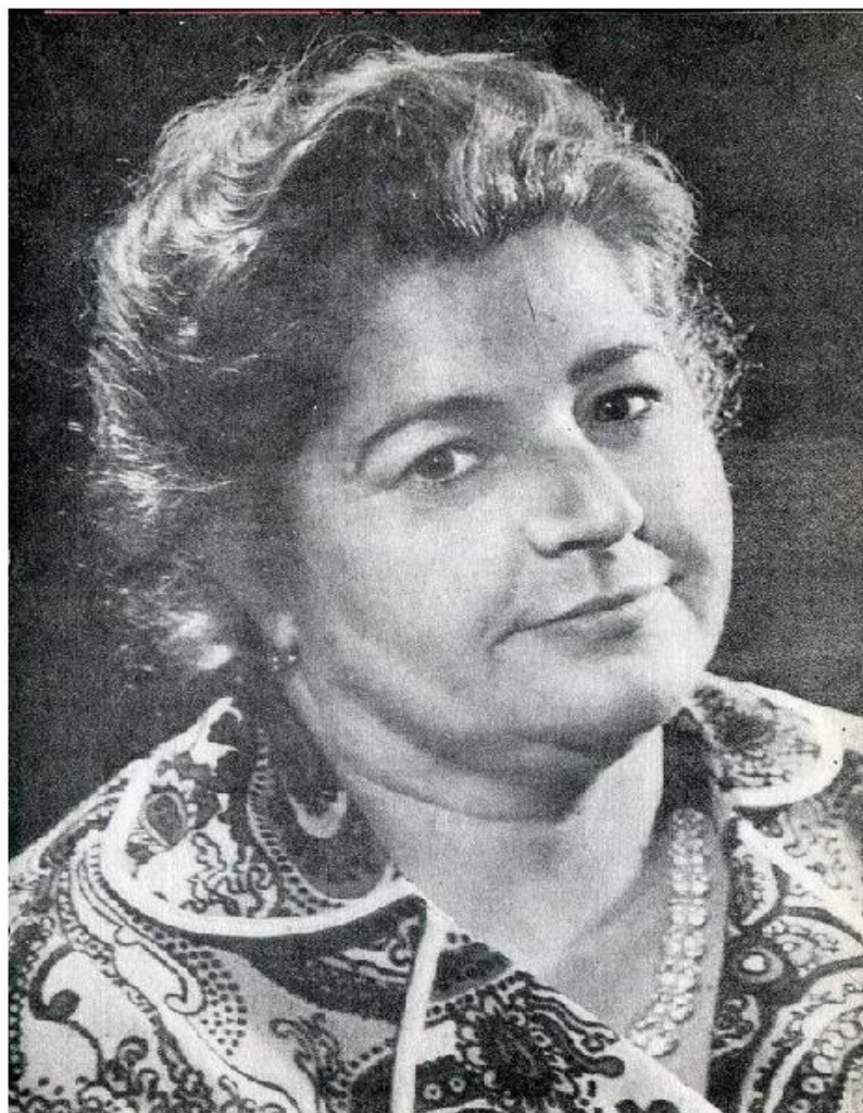
Эмма Эфраимовна Мошковская (1926-1981)